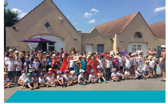
Une kermesse sous le soleil pour clore l'année scolaire 2017 / 2018 !