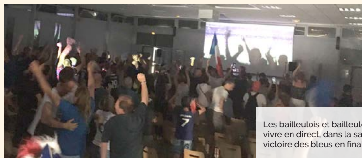
Les bailleulois et bailleuloises ont été nombreux à vivre en direct, dans la salle des fêtes comble, la victoire des bleus en finale de la coupe du monde !