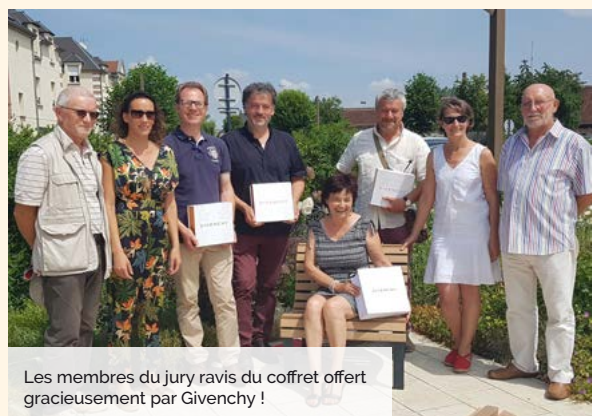
Les membres du jury ravis du coffret offert gracieusement par Givenchy !