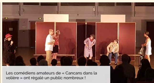
Les comédiens amateurs de « Cancans dans la volière » ont régalé un public nombreux !