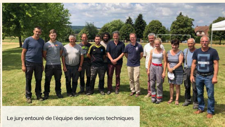
Le jury entouré de l'équipe des services techniques